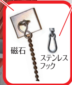
磁石 ステンレス フック