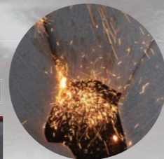
BOX 底内部 (使用例)